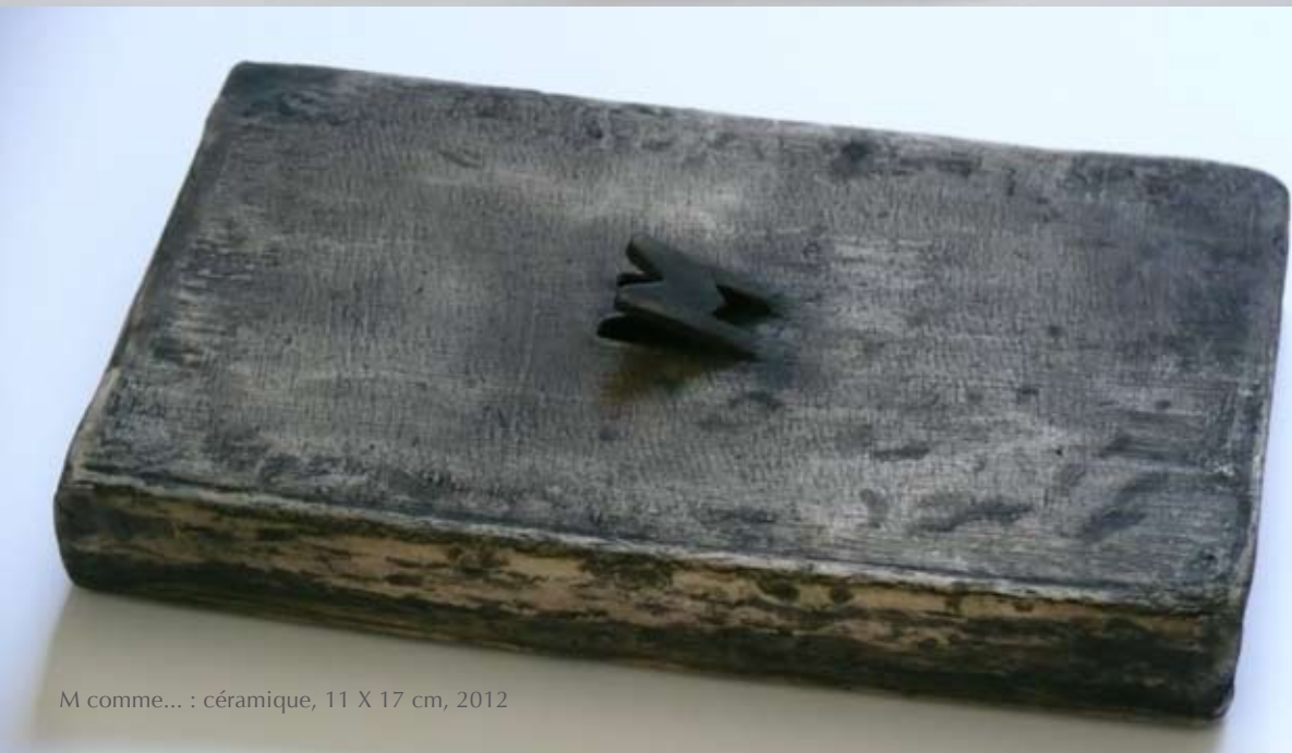
M comme... : céramique, 11 X 17 cm, 2012