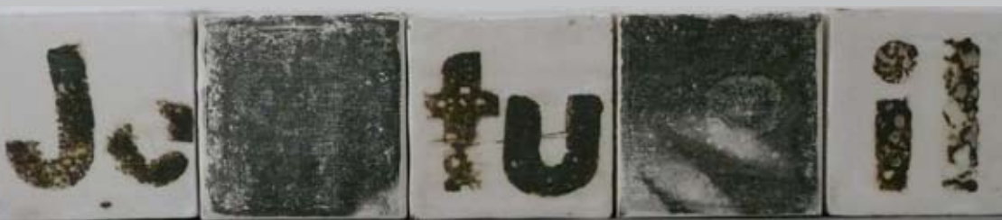
Pronominal : Impressions mixtes sur céramique, 62 x 10 cm, 2010

Massimo Bignardi, Critique d'art Concreta, Toscane, 2011