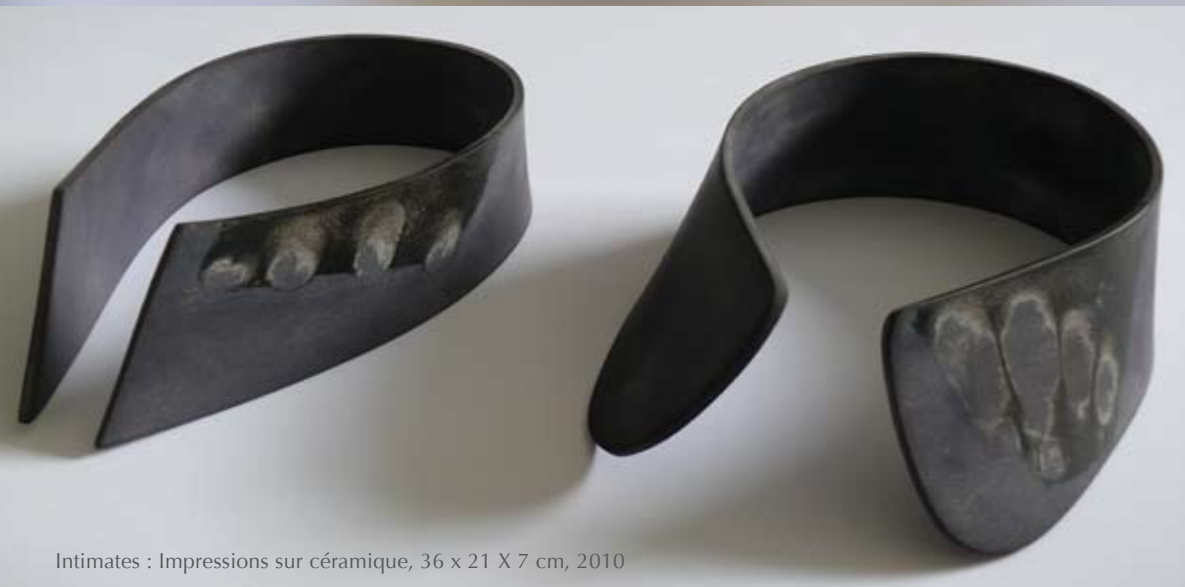
Intimates : Impressions sur céramique, 36 x 21 X 7 cm, 2010