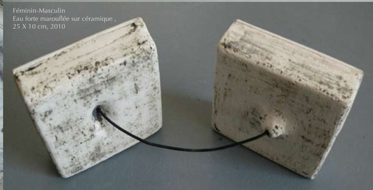
Féminin-Masculin Eau forte marouflée sur céramique , 25 X 10 cm, 2010