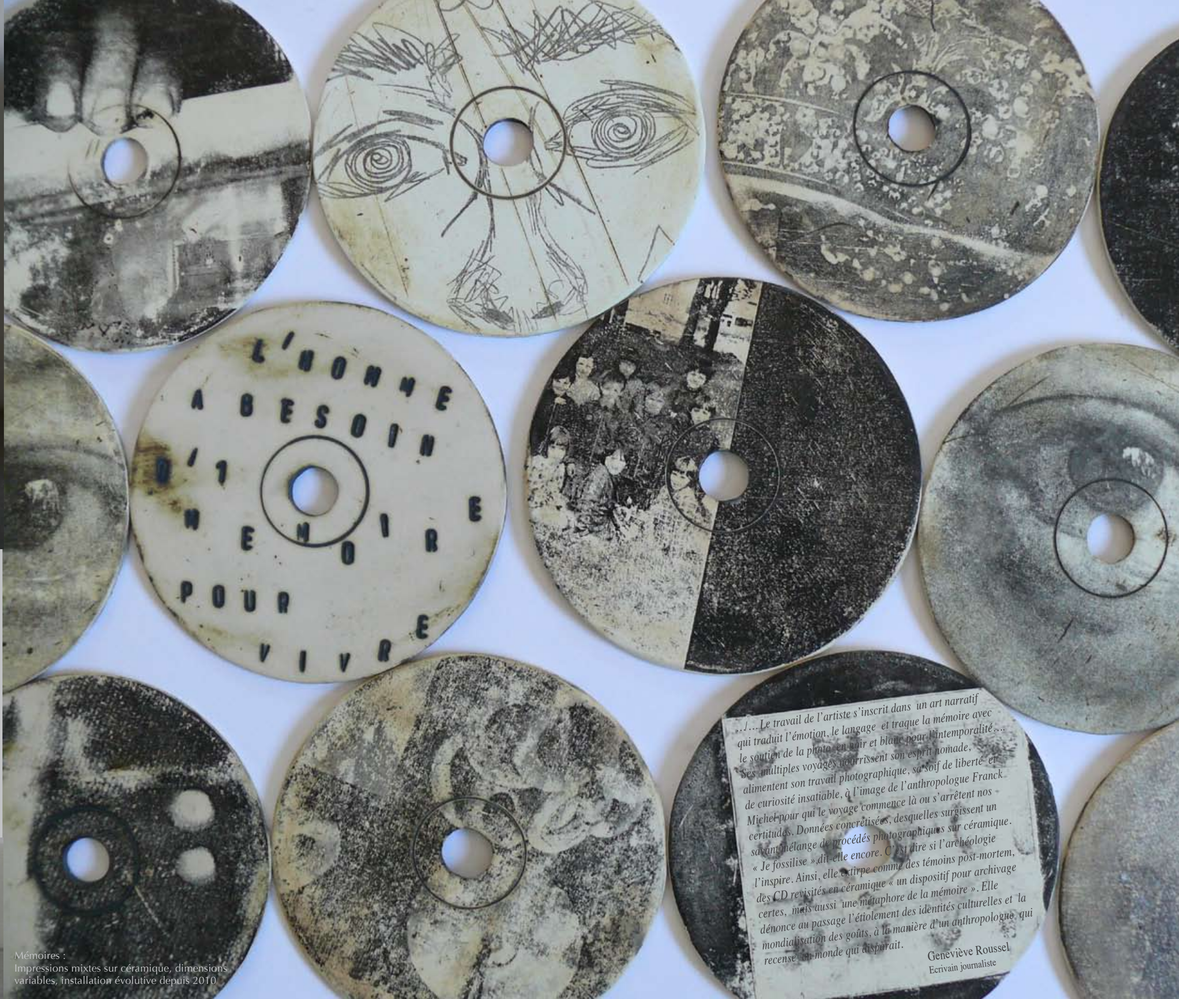
Mémoires : Impressions mixtes sur céramique, dimensions variables, installation évolutive depuis 2010