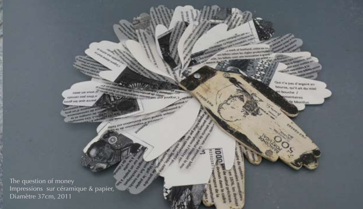
The question of money Impressions sur céramique & papier, Diamètre 37cm, 2011