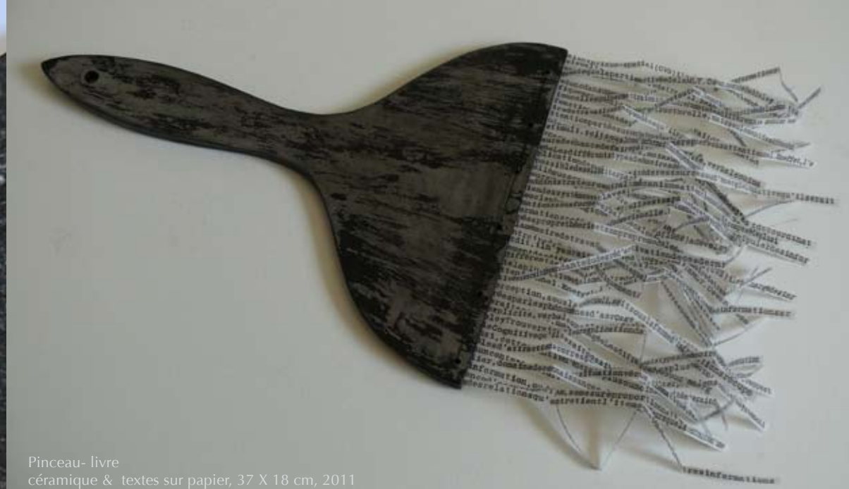
Pinceau- livre céramique & textes sur papier, 37 X 18 cm, 2011