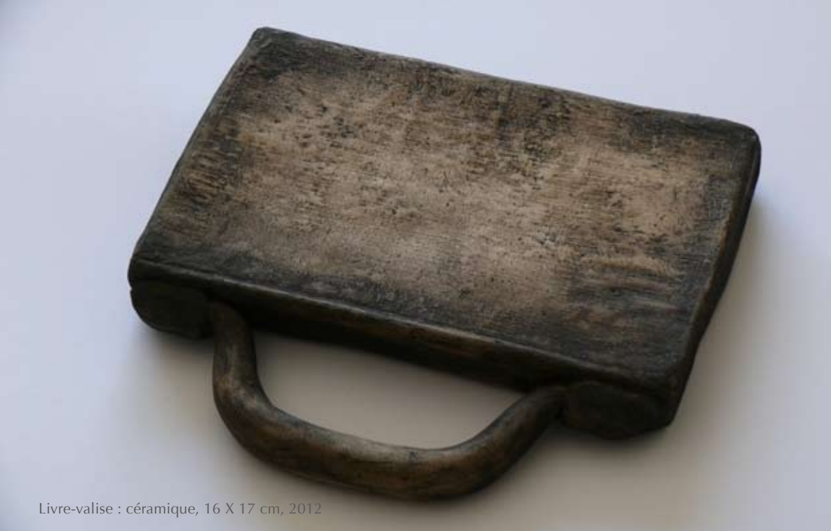
Livre-valise : céramique, 16 X 17 cm, 2012